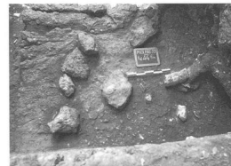
Livello 8: paleosuperficie.