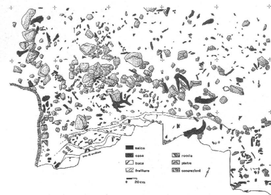
Niveau 16: planimètre du sol d'habitat.