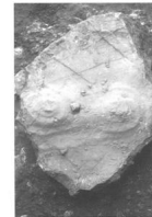
Livello 8: pietra cornuta.

La seconda struttura (livello 16), più antica, erosa e affiorante su una superficie di mq. 15, consiste in un allineamento di pietre ad andamento semicircolare, che si arresta addossandosi alla parete Ovest del Riparo; tali pietre sembrano selezionate, in quanto tutte di media grandezza e, a tratti, sovrapposte.