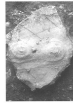
Livello 8: pietra cornuta.

Dell'intera paleosuperficie, che attesta l'intenzionalità da parte dell'Uomo di delimitare, per una qualche sua esigenza, il proprio spazio abitativo, è stato effettuato un calco sia per ragioni espositive che per documentare i rapporti intercorrenti fra le varie porzioni craniche e le pietre