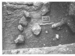
Livello 8: paleosuperficie.

Questa struttura delimita un'area strettamente connessa al cranio di un bisonte rinvenuto in una nicchia sotto roccia, limitrofa al cerchio di pietre.