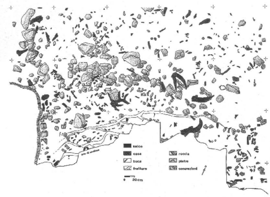
Niveau 16: planimètre du sol d'habitat.